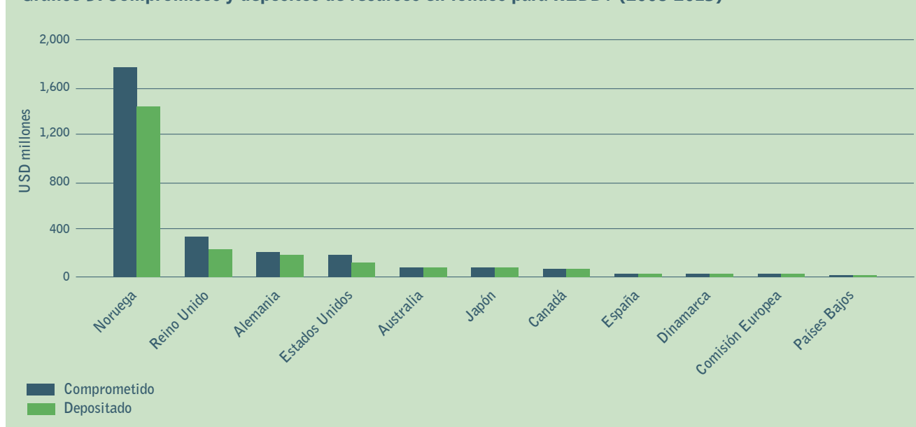
Gráfico 3: Compromisos y depósitos de recursos en fondos para REDD+ (2008-2015)

No obstante, la arquitectura de la REDD+ está cambiando (gráfico 1). El CBFF ha confirmado recientemente que va a reducir sus operaciones tras la notificación del Reino Unido y Noruega de que no van a entregar el último 16 % de sus compromisos iniciales, reponer los recursos ni apoyar una nueva convocatoria de propuestas de proyectos. Este se debe en gran parte a que el conflicto y la inestabilidad política limitan los logros que se pueden alcanzar con el modelo de financiamiento del CBFF. En septiembre de 2015, se anunció una nueva Iniciativa para los Bosques de África Central (CAFI) para apoyar a la región de la Cuenca del Congo, que ya cuenta, sin embargo, con USD 250 millones comprometidos por Noruega para antes de 2021 como pagos basados en los resultados por las reducciones de emisiones. Además, parece que el Fondo Verde para el Clima (FVC), cada vez más activo, va a centrar sus iniciativas, al menos en parte, en el aumento del financiamiento para los bosques, que, según ha determinado, puede contribuir a la mitigación del cambio climático, junto con los beneficios para los servicios de los ecosistemas y los medios de subsistencia.